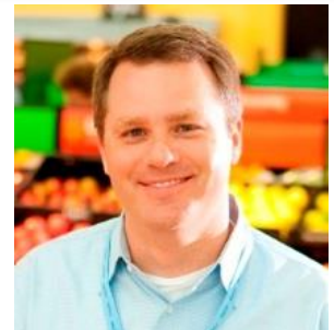
ダグ・マクミロン 社長 兼 最高経営責任者 Walmart, Inc.

社名: Walmart, Inc. 設立: 1962年 アーカンソー州 最高経営責任者: ダグ・マクミロン (Doug McMillon) 従業員数: アメリカ 150万人以上、全世界 計230万人以上 事業規模: 世界28か国の国で、毎週2億人以上のお客様がご利用 売上高: 約5,003 億ドル(内、インターナショナル1,181億ドル)(2018年1月期) 店舗数: 11,718店舗(米国内5,358店舗、インターナショナル店舗6,360店舗) 本社所在地: 702 SW 8th Street, Bentonville, AR 72716-8611