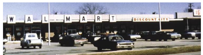
ウォルマート1号店(アーカンソー州)

1962年 ウォルマート1号店開店(アーカンソー州) 1983年 サムズ・クラブ1号店開店(オクラホマ州) 1988年 スーパーセンター1号店開店(ミズーリ州) 1991年 インターナショナル1号店開店(メキシコ) 1998年 ネイバーフッド・マーケット1号店開店(アーカンソー州)