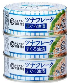
「ツナフレーク まぐろ油漬」 (70g×3 / 258円)