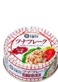
「ツナフレーク かつお油漬」 (70g / 98円)