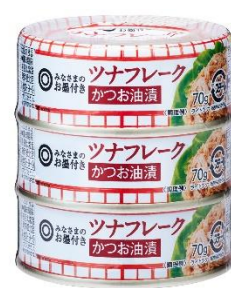
「ツナフレーク かつお油漬」 (70g×3 / 258円)