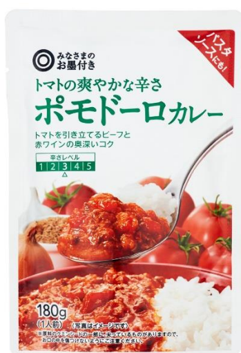
トマトの爽やかな辛さ ポモドーロカレー

生クリームとスパイスのまろやかさにレモンの酸味を加えたカレーです。ココナッツクリームと溶け込んだじゃがいものうま味に、レモンとりんごの爽やかな酸味を加えた、辛いカレーが苦手な方も食べやすい味わいです。