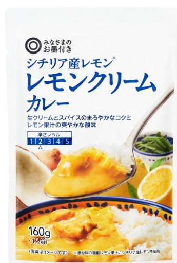
シチリア産レモン レモンクリームカレー