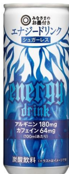
エナジードリンク シュガーレス 158 円 250ml 支持率 87.1%