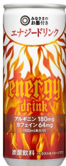
エナジードリンク 158 円 250ml 支持率 90.2%