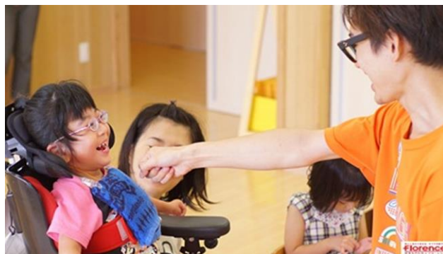
「障害児保育園ヘレン」に通う子どもたちの様子

フローレンスが提供する日本初の居宅訪問型保育事業「障害児訪問保育アニー」の立ち上げを支援。この助成により、保育スタッフの研修費など事業開始初期にかかる資金をサポート。「障害児訪問保育アニー」では、訪問看護ステーションと連携し、慣れ親しんだ環境で個別対応が必要な子どもそれぞれに合った保育と訪問介護サービスを提供。